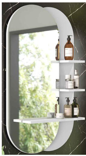
Toscana Espelheira Toscana Mirror Toscana Espejo

Instrucciones: Antes de iniciar el montaje e instalación de mobiliario, lea atentamente todas las instrucciones. El montaje y la instalación del producto deben realizarse sobre una superficie limpia y plana. Recomendamos la contratación de profesionales para llevar a cabo los sistemas hidráulicos y eléctricos.